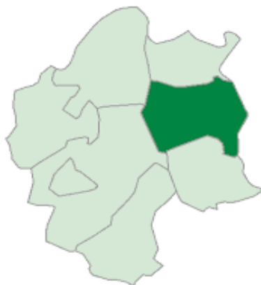
Mapa nr. 2 na podstawie Statystycznego wademecum samorządowca 2020