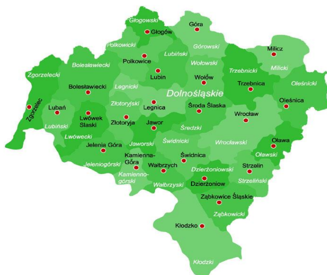
Mapa nr. 1 https://wczasypolskie.pl/powiaty-w-polsce-zadania-mapa-powiatow?start=3

Poniżej przedstawiono dwie mapki, które odpowiednio nr1. Przedstawiają usytuowanie powiatu oleśnickiego w województwie dolnośląskim, nr 2 gminy Syców w powiecie oleśnicki.